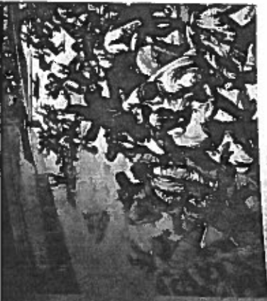
« D'insécurité rouge » Saint-Petersbourg, 22 janvier 1905 L'armée tire sur une foule paisible et fait 300 morts.

d'exploitation, qui accompagnent tous les jours la phase initiale de l'industrialisation. À l'autre extrémité de l'échelle sociale, une bourgeoisie capitaliste franchement créée entre en conflit avec la vieille aristocratie foncière, jalouse de ses prérogatives séculaires.