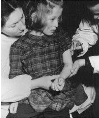
Le personnel des Nations Unies vaccine un enfant de 11 ans rescapé du camp de concentration qui avait été victime d'expériences médicales au camp d'Auschwitz. Camp de personnes déplacées de Bergen-Belsen, Allemagne, mai 1946. Photographie »