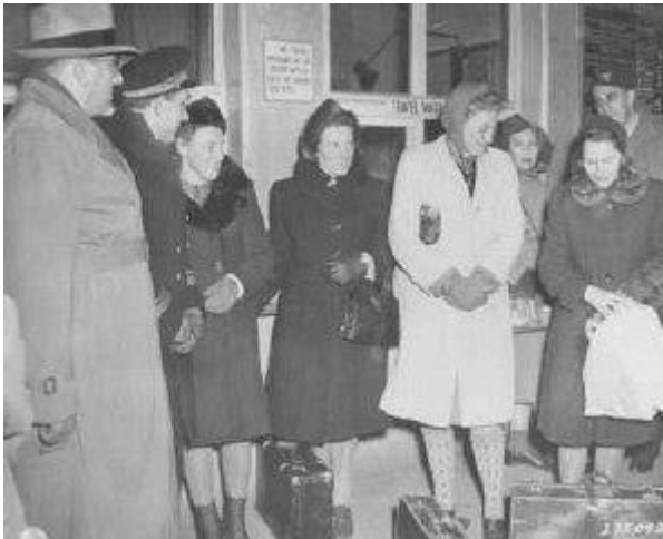
Experts médicaux et victimes des expériences médicales au camp de concentration de Ravensbrück, avant leur témoignage lors d'un procès contre des médecins nazis. Nuremberg, Allemagne, 16 juin 1947. Photographie »