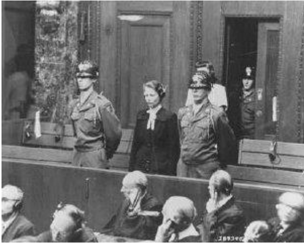
Herta Oberhauser, l'un des médecins nazis jugés pour avoir mené des expériences médicales sur les détenus des camps de concentration. Nuremberg, Allemagne, août 1947. Photographie »