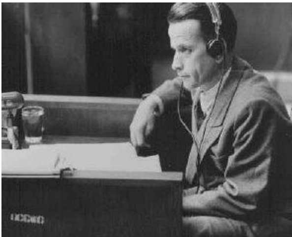
Waldemar Hoven, médecin chef SS au camp de concentration de Buchenwald au cours de son procès devant un tribunal militaire américain. Hoven menait des expériences médicales sur les détenus. Nuremberg, Allemagne, 23 juin 1947. Photographie »