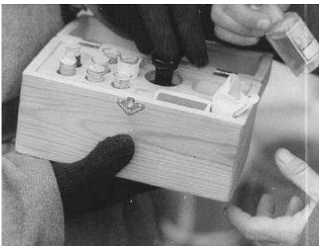
Des soldats soviétiques inspectent une boîte contenant un poison utilisé lors d'expériences médicales. Auschwitz, Pologne, après le 27 janvier 1945. Photographie »