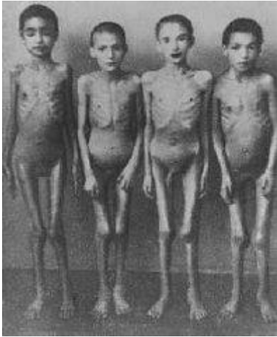
Victimes des expériences médicales du Dr Josef Mengele à Auschwitz-Birkenau. Pologne, 1944. Photographie »